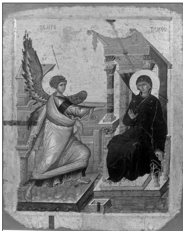
Icoana Bunei Vestiri, Ohrid, Macedonia

suferit pentru a-L mărturisi pe Hristos în închisorile comuniste. Rămâne ca și Biserica Ortodoxă Română să realizeze un martirologiu creștin cu preoții, monahii, creștinii și intelectualii români care au suferit și au murit în închisorile comuniste. Din punct de vedere istoric, persecuția comunistă, condusă de dictatorii comuniști, poate fi asemănată cu cea declanșată de împărații romani împotriva creștinilor în primele trei secole creștine.