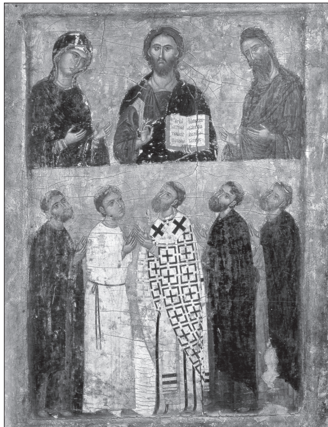
Deisis cu cinci Sfinți Mucenici, icoană de la Mănăstirea Sfânta Ecaterina, Egipt

„– De care Biserică ții? De a Bizanțului? A Romei? A Antiohiei? A Alexandriei? A Ierusalimului? Iată că toate s-au unit acum împreună cu eparhiile supuse lor. Deci, dacă ții de