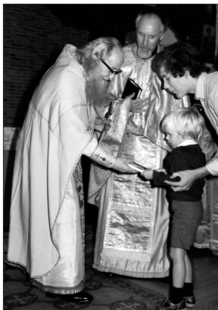
Părintele Sofronie Saharov în vizită la parohia Sfântul Andrei din Belgia, întemeiată în anul 1972.

amorul tău propriu și nu M-ai cinsti pe Mine. Deci ele să nu fie un motiv pentru care tu nu Mă cauți și stai departe de Mine. Apropie-te cu dragoste! Unui fier negru flăcările unui