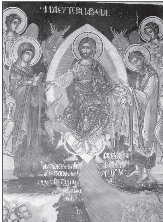
Cea de a doua Venire a Domnului, icoană din Catedrala Mănăstirii Varlaam – Meteora, 1566.

personal pentru a oferi un răspuns creștin ortodox „cu greutate” copilului, la provocările lumii pe care acesta ni le pune în față. Mai departe, copilul care a crescut în acordurile muzicii clasice de calitate nu va fi ispitit de ritmurile și mesajele muzicii rock, cu toate sub-genurile ei, așa cum este o persoană care a crescut în afara unei educații muzicale. Copilul care a învățat să vadă frumosul în pictura și sculptura clasică nu se va lăsa atras cu ușurință de revistele, cărțile și filmele pornografice. Muzica bună, literatura bună, o cultură temeinică, o educație prin care copilul își însușește (implicit – înțelege) principiile de bază ale unei vieți morale, creștinești, sensibilizează sufletul, îl rafinează, pregătindu-l pentru a primi impresiile spirituale și a respinge duhul antihristic al lumii. Un tânăr bine pregătit, un tânăr cult, va putea face față ispitelor grosiere, va putea avea puțința de a-și selecta anturajul după propriile standarde, va da dovadă de seriozitate, de profunzime, de demnitate – lucruri de care un tânăr ce primește necondiționat tot ceea ce societatea îi oferă nu va putea beneficia. Aceasta însă presupune un efort, o atenție și implicare sporită a familiei și Bisericii în formarea copiilor.