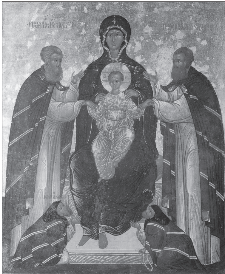
Icoană portabilă rusească de secol XVI, Muzeul Benaki, Atena

este mult mai importantă decât decizia unui aparat instituțional, birocratic și impersonal. Familia creștină reprezintă spațiul intim cel mai de preț pentru cultivarea iubirii conjugale, a iubirii părintești, a iubirii filiale și a iubirii frățești. Lipsa de iubire și comuniune în familie duce la înstrăinarea între membrii acesteia, la vi-