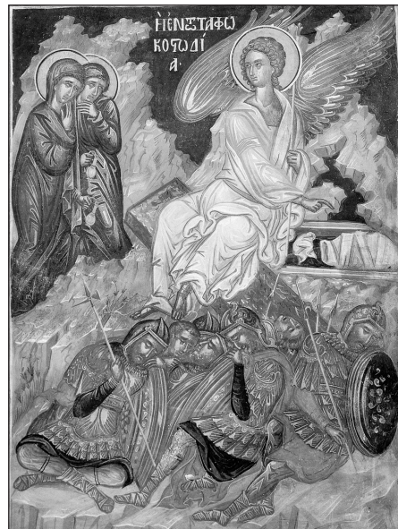
Îngerul în fața Mormântului gol, Catoliconul Mănăstirii Filantropion, Insula Ioanina, 1542.

totdeauna a Vieții celei veșnice și nescricăcioase. Acum nu mai murim ca niște osândiți, ci așteptăm ca niște ridicăți din moarte învierea cea de obște, pe care o va plini la timpul cuvenit Cel care a lucrat-o întru Sine și ne-a dat-o în dar, dacă ne vom uni cu El.