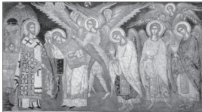
Liturghia Îngerească, pictură murală din biserica Mănăstirii Filantropion, Insula Ioanina, 1542.

biblică și istorică a Mântuitorului constituie, de fapt, realitatea cultică, euharistică a Lui, iar Taina Sfintei Euharistii este o „capodoperă a iubirii, a milei și a atotputerniciei divine” 1 . Centrul cultului liturgic al Bisericii este recunoscut în mod covârșitor ca fiind Euharistia. “Trupul istoric al lui Iisus Hristos, așa cum a trăit, a murit și a înviat, cum strălucește preamărit la dreapta Tatălui, se găsește în