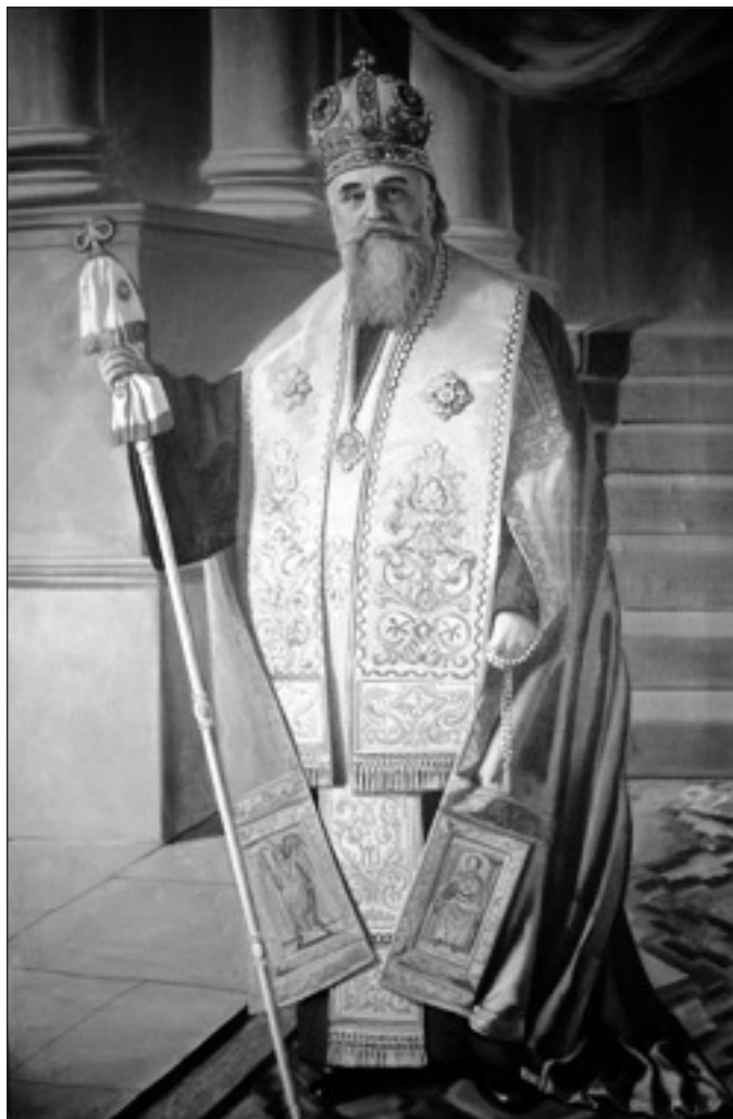
Adormitul întru fericire, Miron Cristea, Cel Dintâi Patriarh al Bisericii Ortodoxe Române (1925–1939).

Pe fondul conținutului acestui canon, teologii ortodocși mai sus menționați arată că dintru început, Biserica creștină a luat în mod serios, în considerare, elementul