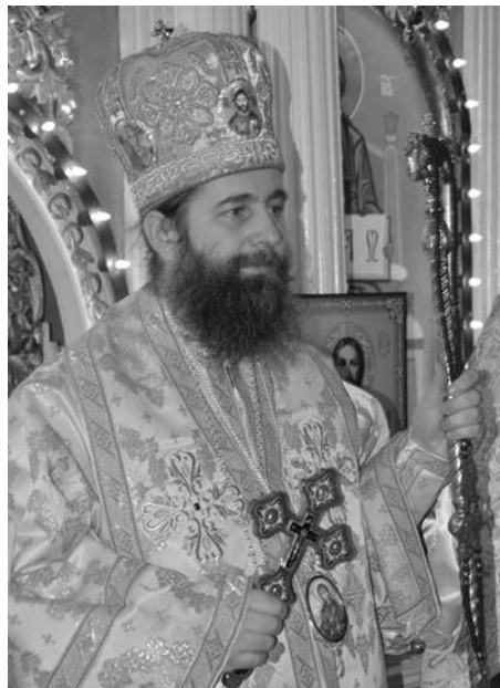
Preasfințitul Părinte Siluan, Episcopul Eparhiei Ortodoxe Române din Ungaria, începând din anul 2007

o posibilitate pentru noi.) Trebuie să îndemnăm românii locuitori în localitățile mai mari, ca să încerce să adună alți conaționali, creind nucleul unei eventuale comunități (de pildă Szolnok, Miskolc, Dobrițan). La acest capitol