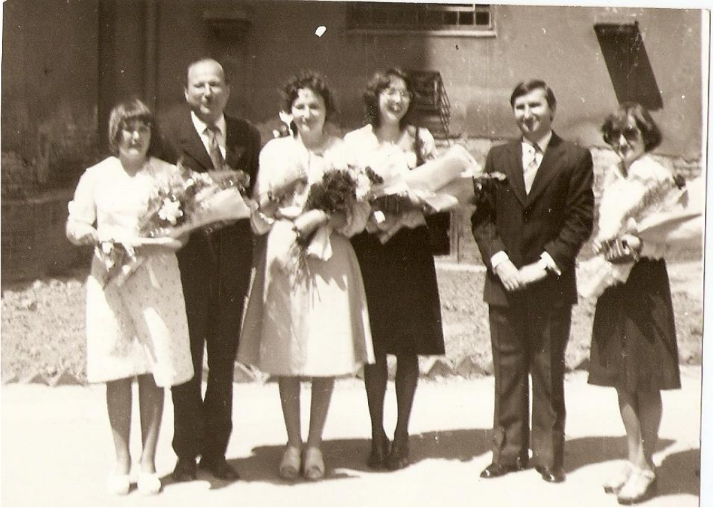
Serbarea de rămas bun, 1976