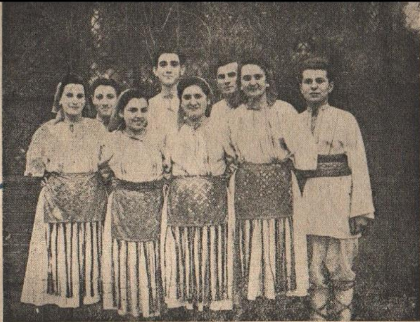
Studentii anului preparator dela Școala Superioară din Budapesta